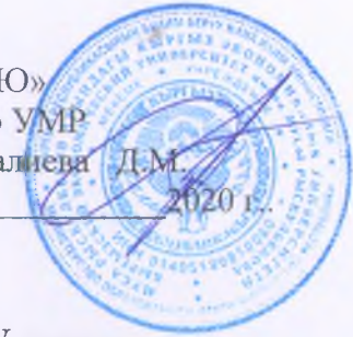
ГРАФИК Сдачи экзаменов на первое полугодие 2020-2021 учебного года студентов IV курса Направления «Экономика», профиль «Финансы и кредит»